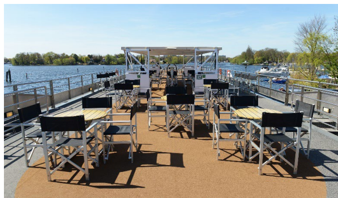
MS Saxonia, Sonnendeck

Wir erreichen Berlin Spandau am frühen Morgen. Nach dem Frühstück sagen wir der MS Saxonia Lebewohl und treten die Heimreise an.