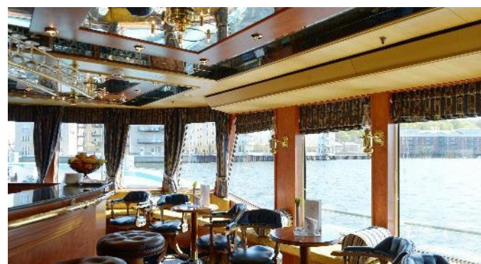
MS Saxonia, Panoramabar